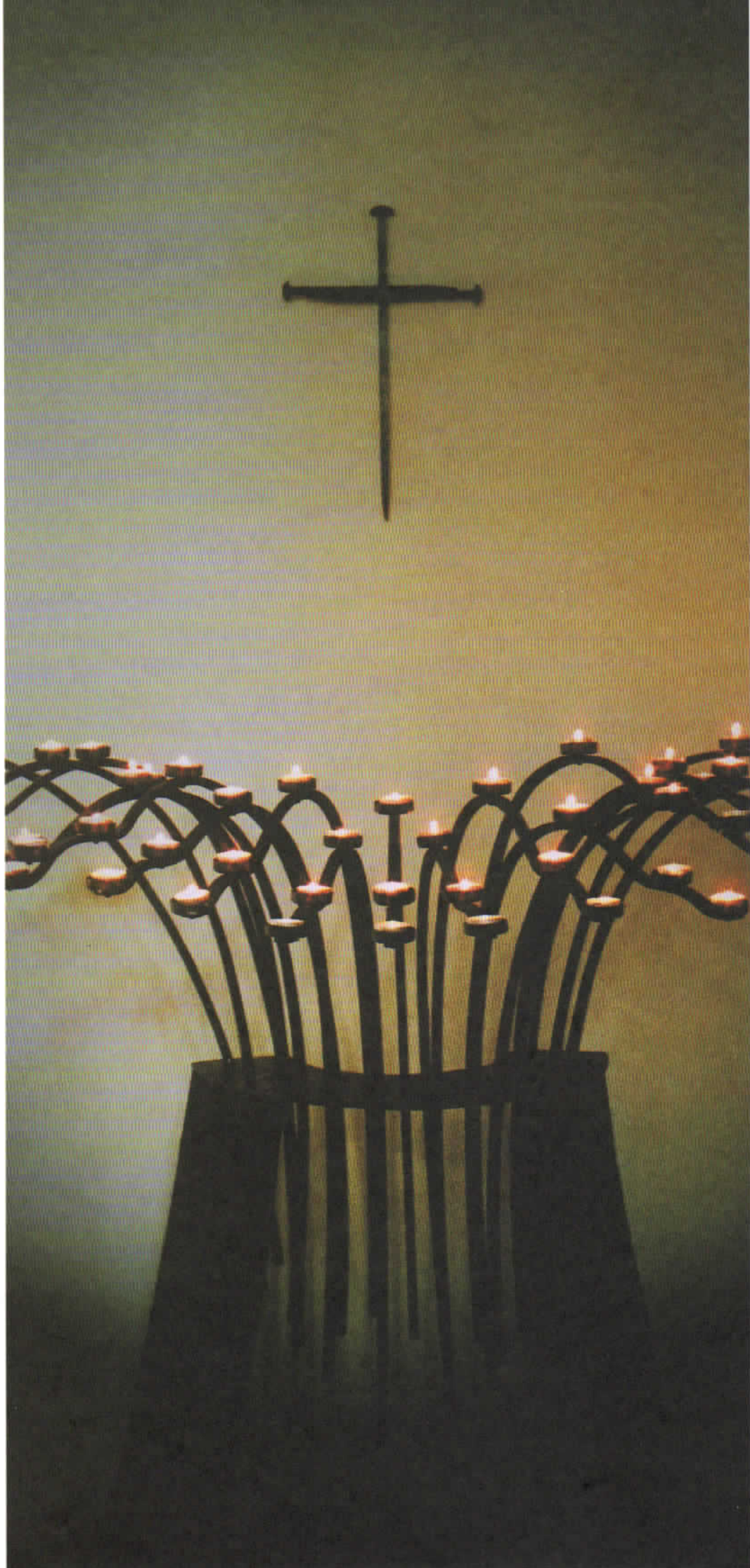
Abbildung auf den Innenseiten: Hammer, Christian Gottlob 1779 – 1864 Die Elbe bei Schloss Pillnitz mit Kirche »Maria am Wasser« in Hosterwitz und Blick zur Sächsischen Schweiz Aquarell, 22 x 30,5 cm, bez. u. dat. u. Mitte »1850« SLUB/Deutsche Fotothek Aufnahme: Herbert Ludwig, Mai 1956